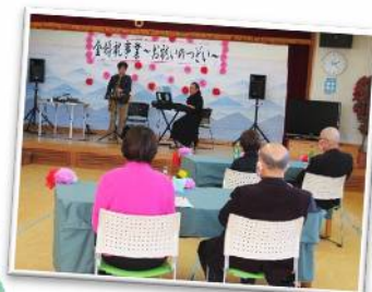
令和4年度年、金婚祝事業 お祝いのつどいの様子

申込みをされた方には、後日改めて詳細をご連絡いたします。なお、お祝いのつどいは 10月12日（木）総合福祉センター1階 松の間にて開催を予定しております。