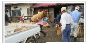
令和4年7月 豪雨災害時 活動の様子