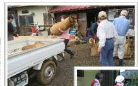
令和4年7月 豪雨災害時 活動の様子